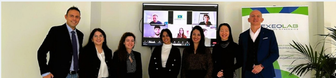
Auftakttreffen in Potenza (IT) - 15/12/2023

Das Wohlbefinden am Arbeitsplatz ist ein wichtiges Thema auf der Tagesordnung von Unternehmen und Politik in aller Welt. In jüngster Zeit hat es aufgrund der Pandemie und ihrer Auswirkungen auf unsere Arbeit noch mehr an Bedeutung gewonnen. STAY OK will sich dieser Herausforderung stellen und sich dabei insbesondere auf kleine Unternehmen konzentrieren, die im Bereich der freiberuflichen und beratenden Dienstleistungen tätig sind , um ihre Attraktivität auf dem Arbeitsmarkt zu erhöhen und dem Trend zur großen Resignation entgegenzuwirken.